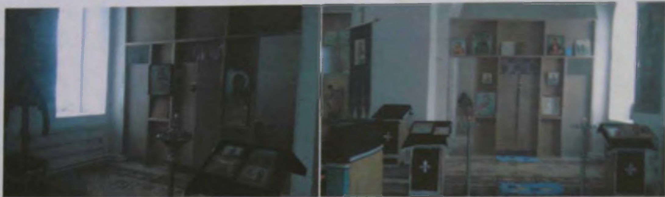
Ризница Иоанна Богослова

В 2001 году были сделаны полы и проведено отопление. Но батюшка не хочет останавливаться на достигнутом – планируется строительство колокольни, и реставрация южного предела в честь Федоровской Божьей Матери и ризничной в честь Иоанна Богослова.