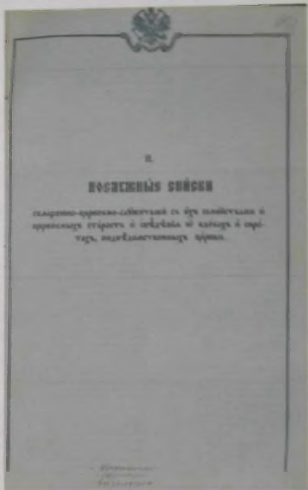
Рис. 6. Титульный лист