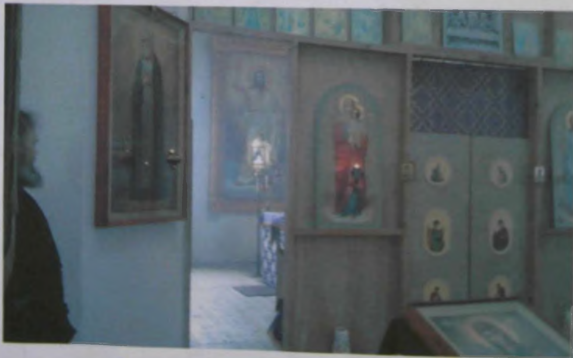
Отреставрированная икона Спасителя в алтаре.