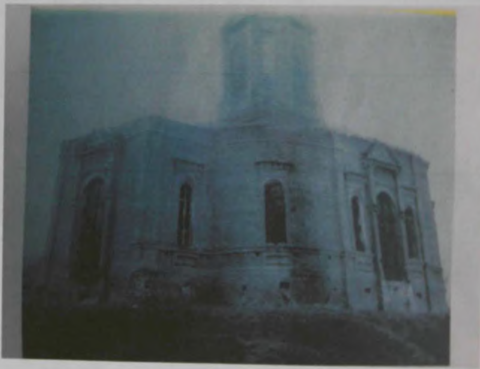
Храм до реставрации, 1980 год.

В соответствии с Федеральным Законом «О свободе совести и о религиозных объединениях» от 26.09.1997 г. зарегистрирована религиозная организация - православный Никитский приход (Московский патриархат) в с. Паники (16 ноября 1999 г. № 134р).