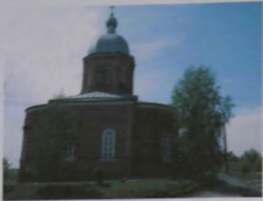
Богородицко-Никитский храм села Паники.

Над храмами сверкают купола, Народу возвращаются иконы, И мы идём и отдаём поклоны, Под звон, что издают колокола... Вернулось то, что ждали много лет, Вернулась Вера к русскому народу, Пройдя через гоненья и невзгоды, Заблудшим душам подарила свет.