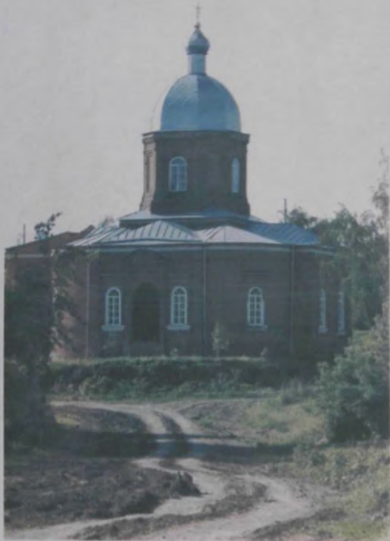
Храм в ходе реставрации, 1999 год.

Десятки лет никакого ремонта в церкви не производилось. В результате, когда приходу вернули храм, в нем на месте купола росла трава, с потолка капала вода, был разрушен пол, выбиты окна, осыпалась штукатурка, старинные фрески уходили в небытие.