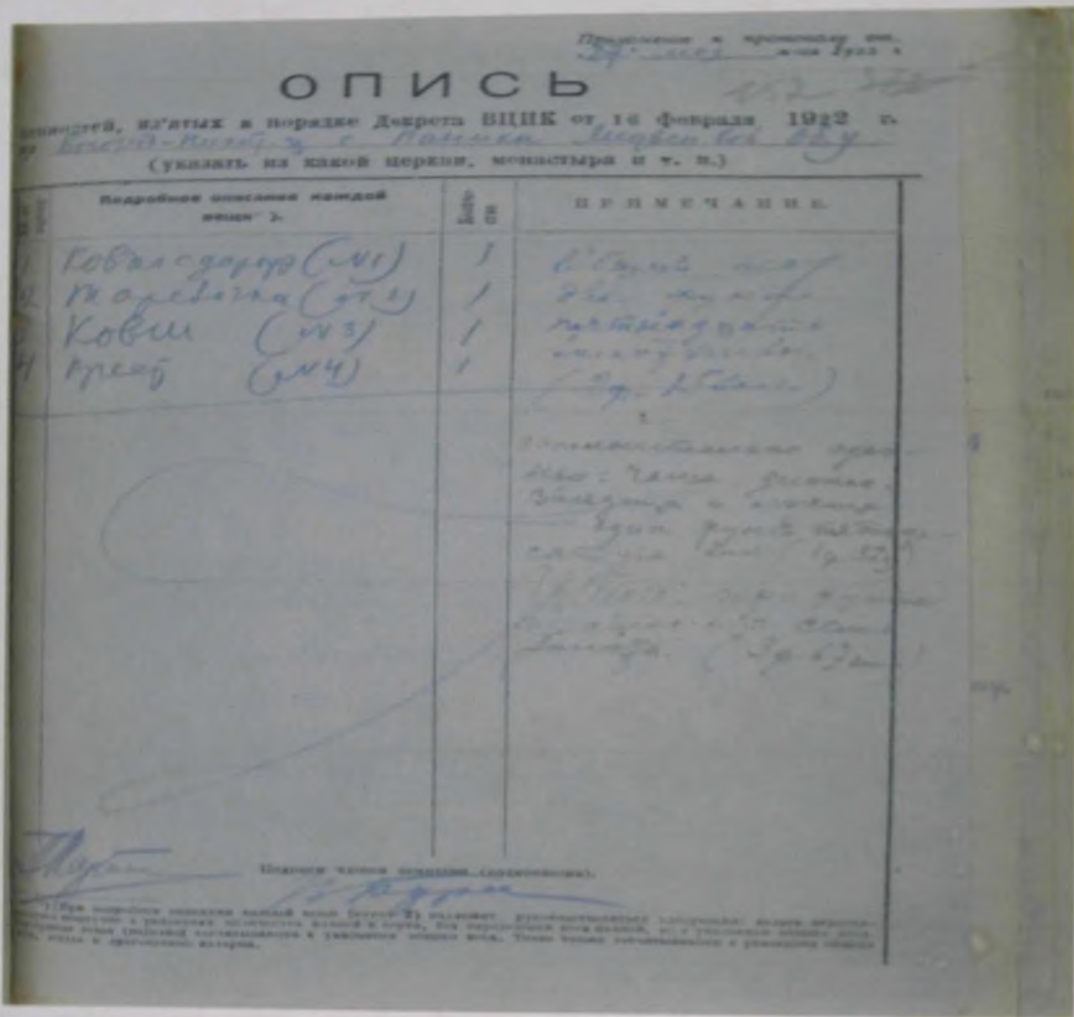
Рис. 9 Опись изъятых ценностей.