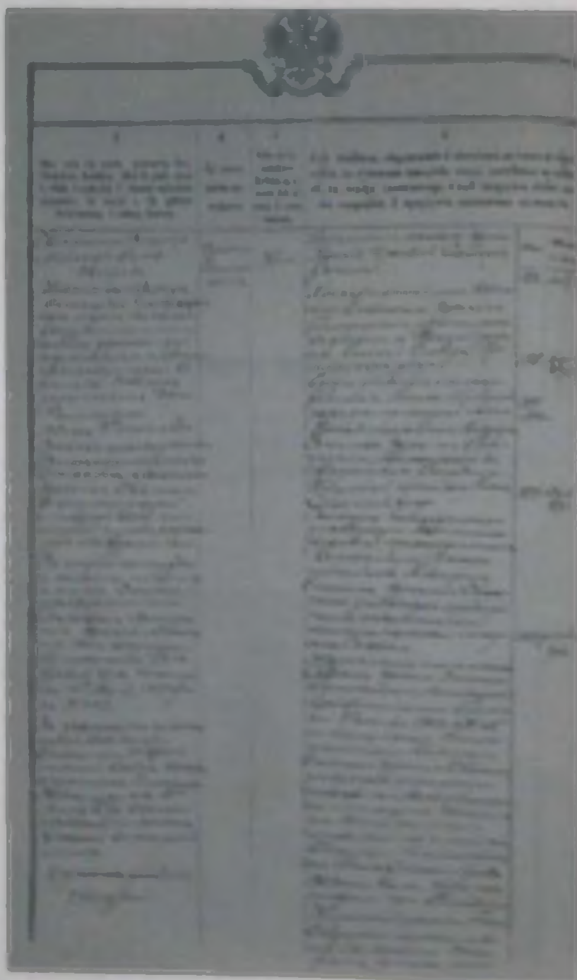
Рис. 7. Послужные списки.