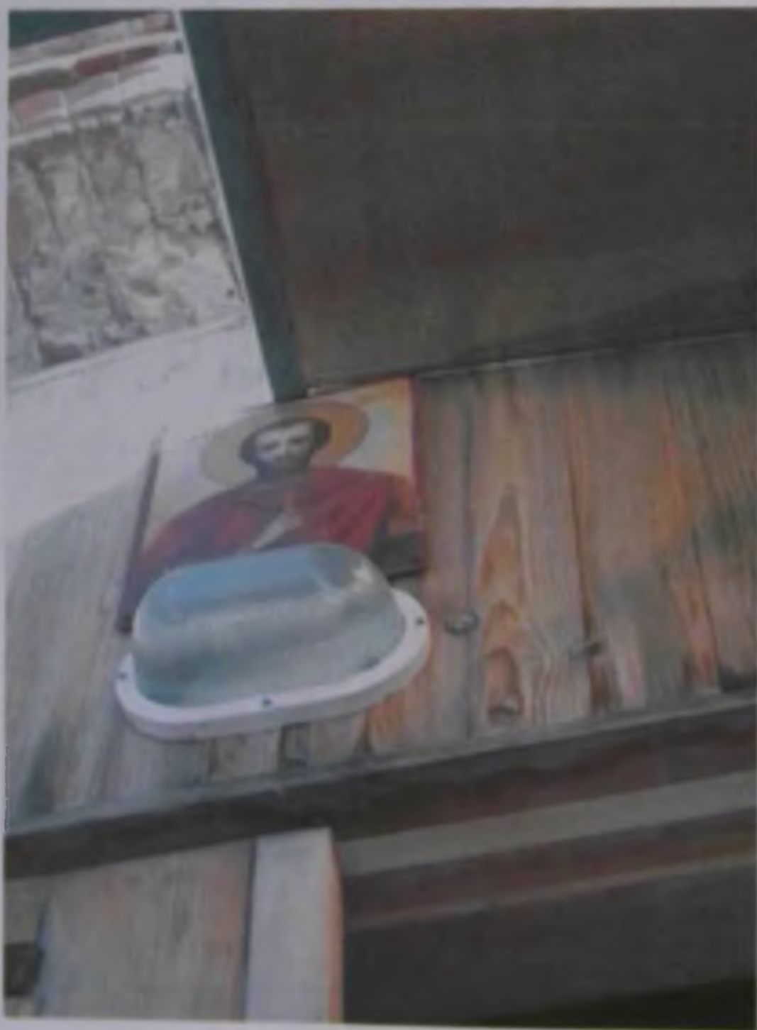
Икона Никития перед входом в храм.

От бабушек и жителей нашего села мы часто слышим, что храм в Паниках - Никитский, а Божья Матушка его и всех людей оберегает. С вопросом об освещении храма обратились к нашему отцу Николаю. Оказывается, наш храм уникален! Архивные источники говорят, что величественный храм освящен в честь война Никиты, который, однако, никогда не был в нашем селе.