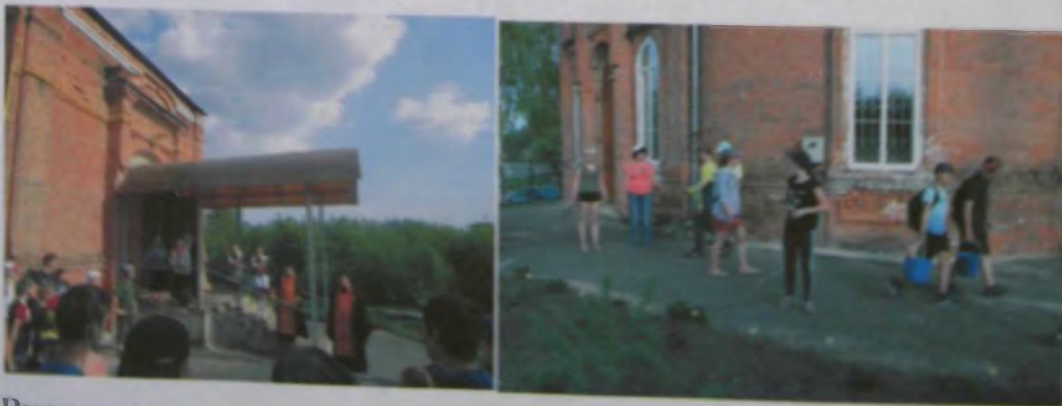
Выступление перед участниками велопробега

8 Мая 2018 года мы выступали публично перед участниками велопробега, который проводился в Медвенском районе среди обучающихся и преподавателей школ и был посвящен Дню Победы. Почти 100 человек смогли познакомиться с историей нашего храма и принять участие в его благоустройстве.