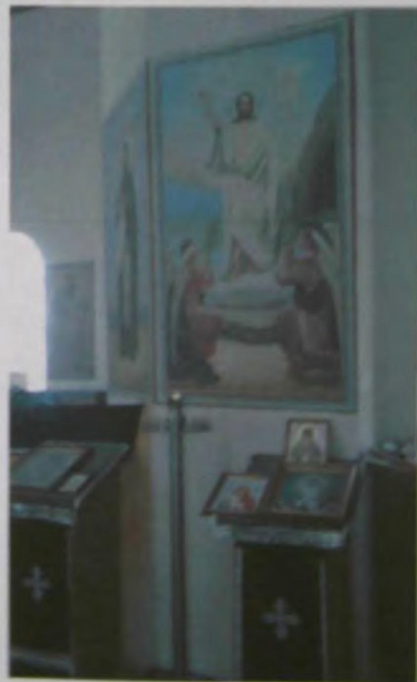
Иконы после реставрации.